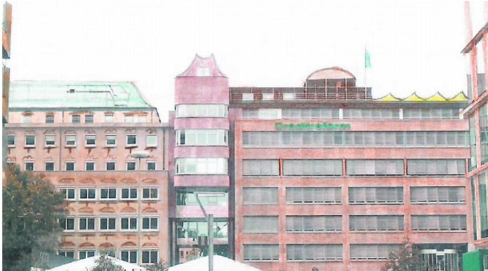
Beispiel für Dachaufbauten, um die Dachlandschaft zu revitalisieren (+ warme Fassadengestaltung)