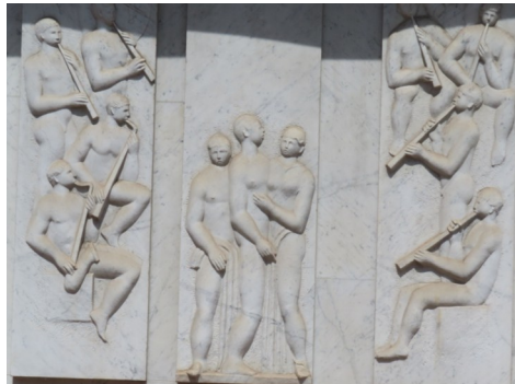
Fast ein früher Lenk ...