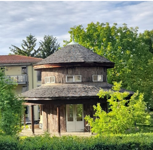
Garten- oder Tainihaus